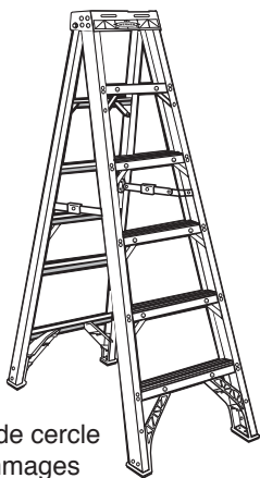
Zones de cercle de dommages